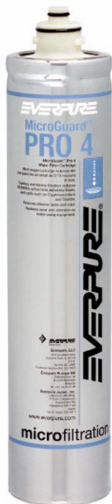
MicroGuard™ Pro 4 Patrone: 9637-02

Trinkwasser in Premiumqualität für flaschenlose Cooler und Trinkwasserbrunnen