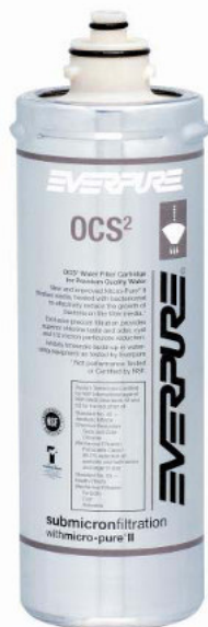
OCS Filterpatrone: EV961807

Liefert Premiumwasser höchster Qualität für Office Coffee Anwendungen