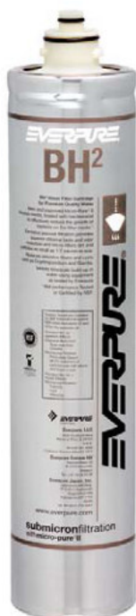
BH 2 Filterpatrone: 9612-51

Liefert Premiumwasser höchster Qualität für Kaffeeanwendungen