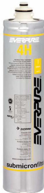
4H Filterpatrone: EV961100

Liefert Premiumwasser höchster Qualität für Kaffeeanwendungen