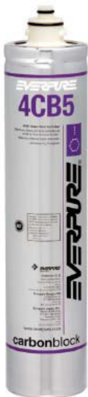
4CB5 Austauschpatrone: EV9617-16

Liefert Premiumwasser höchster Qualität für Lebensmittel-, Vending und OCS-Anwendungen.