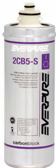
2CB5-S Austauschpatrone: EV961722

Liefert Premiumwasser höchster Qualität für Lebensmittel-, Vending und OCS-Anwendungen.